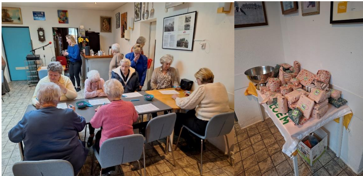
Muziekbingo voor de Zonnebloemgasten

Geuzenveld, met uitstapjes naar Slotermeer en de Tuinen van West. Inmiddels is de 3 e GLI-groep al in De Brug bezig, met hetzelfde doel. En ook van deze groep zijn inmiddels deelnemers aangesloten bij onze wandelgroep. Er wordt daarnaast zomers buiten en in de winter in de sportzaal van het Koggeschip gesport. Het GLI-project loopt is in oktober afgelopen en gestopt. We zijn heel erg geïnteresseerd in een soortgelijk project, of een voortzetting van het huidige. Omdat het zeker in een behoefte voorziet, mensen bewust maken van hetgeen ze eten en drinken en daarin positieve veranderingen proberen mee te geven. En het bewegen als meerwaarde is zeker nuttig. Wij zullen de wandelgroep zeker in stand houden!