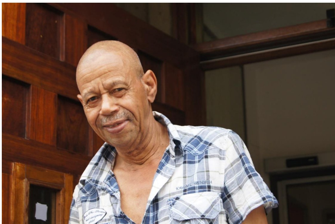
Ruim 20 jaar onze Huismeester