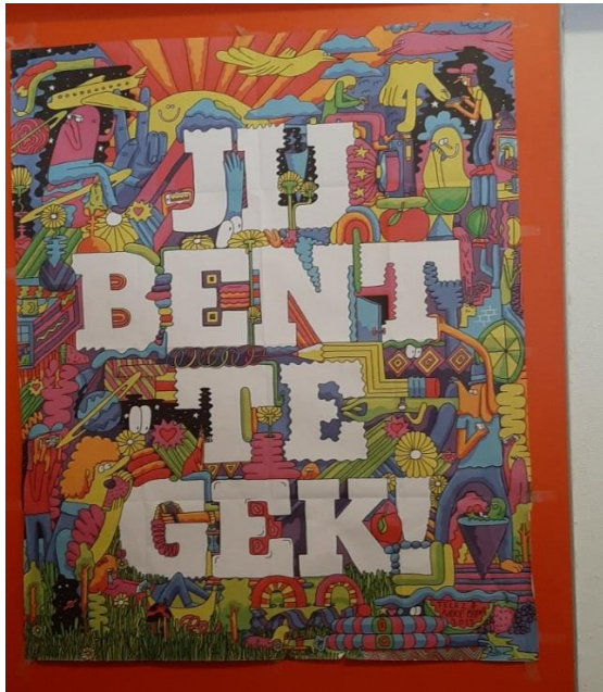
Tekst in het vrijwilligerskantoor

Daarnaast verzorgen wij voor al onze vrijwilligers cursussen die belangrijk zijn met het oog op onze kwetsbare groepen, waaronder sociale hygiëne voor onze gastvrouwen en koks(hulpen) en EHBO-cursussen. In dat kader hebben we onze oude AED dit voorjaar ook vervangen door een huur-AED. Dit kan voor een redelijke huurprijs en met een jaarlijkse controle en vervanging na gebruik en/of bij storingen.