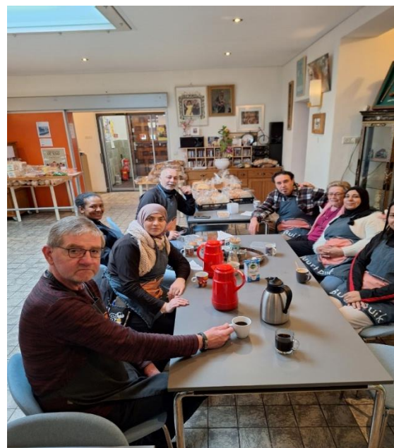
Mini AZC tijdens de zondagse Buurtbuik