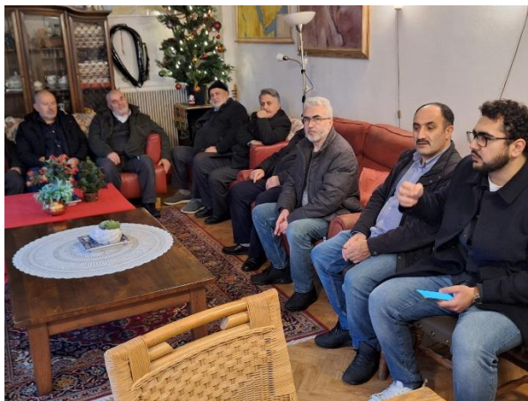
Kumbet op bezoek bij de Brug

gekomen. De nieuwe agenda commissie van het IZO heeft met veel inzet en overleg met de te bezoeken belangrijke partijen in de diverse buurten, de wijkverkenningen alsnog uitgevoerd. Door de eigen vrijwilligers en/of deelnemers mee te nemen in de verkenningen, is de onderlinge bekendheid van de andere activiteiten en partijen/ stichtingen in de eigen buurten vergroot. De deelnemers en bezoekers van de Brug hebben deze wijkverkenning als zeer nuttig en voor herhaling vatbaar ervaren. Graag doen we in 2025 weer mee.