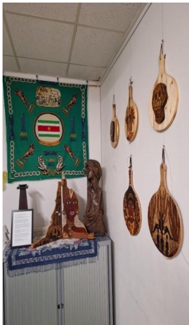
De permanente Keti Koti-hoek

In De Brug lossen we alle problemen op door met respect en mededogen naar elkaar te luisteren, te helpen waar we kunnen en iedereen in zijn of haar waarde te laten. Solidariteit met mensen die het moeilijk hebben, daadwerkelijk hulp bieden of zorgen dat deze problemen op de plek komen waar ze het meeste kans hebben op een duurzame oplossing en dit ook monitoren. Altijd de dialoog laten prevaleren boven het conflictmodel, zo willen wij vanuit ons multiculturele gedachtegoed streven naar een eerlijker en meer gelijke wereld, te beginnen dicht bij huis. Ondertussen blijven we ons verzetten tegen alle vormen van onderdrukking en geweld, onderling of tegen anderen. Waarmee ook de jaarlijkse Keti Koti-herdenking en -viering in De Brug een vaste plaats heeft.