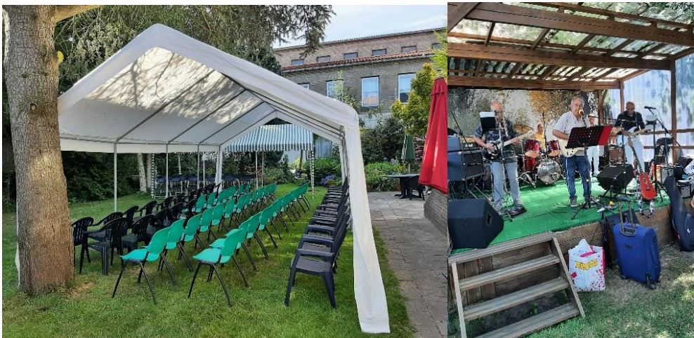
Tent in de tuin in afwachting van de bezoekers en onze Huisband test het geluid

Na de aanleg van zonnepanelen op het dak van ons (VVE) gebouw, moest er opnieuw een bedrag uit het MOP Meerjaren Onderhoud Plan, worden vrijgemaakt. Dit keer voor het vernieuwen van het dak van onze Hal/ de Patio van de 1 e etage. Gelukkig is daarmee een einde gekomen aan een langdurige lekkage in een van onze kantoren. Het laatste grote aandachtspunt voor de Brug was de verwarming in de Brug. Een groot aantal radiatoren gaf te weinig of geheel geen verwarming meer, mede door de automatisch en van afstand bedienbare radiatorkranen. Omdat veel gasten of vrijwilligers deze kranen onjuist gebruikten en stuk draaiden, ging het vaak helemaal mis. Hierdoor moesten wij besluiten tot opzegging van deze (huur)kranen en de aanschaf van nieuwe klassieke radiatorkranen en het vervangen van 2 radiatoren. Dat is inmiddels gebeurd en nu werkt alles weer optimaal. Maar het was nog wel een laatste onvoorziene kostenpost, die volledig ten koste van de Brug zelf kwam.