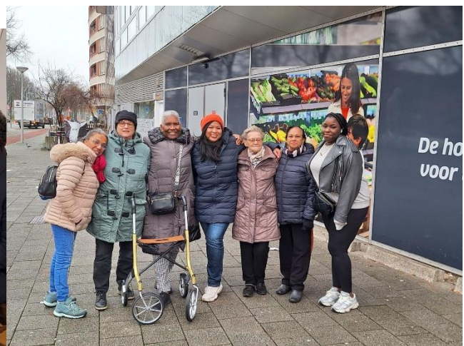
Onze deelnemers aan de Wijkverkenning