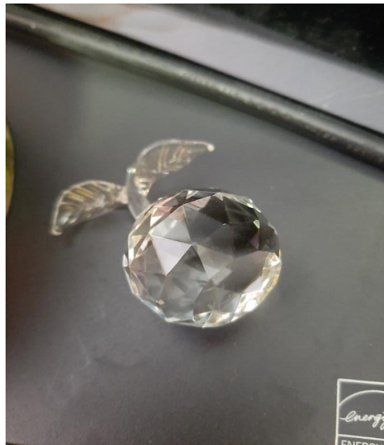
Kristallen appeltje voor supervrijwilligers