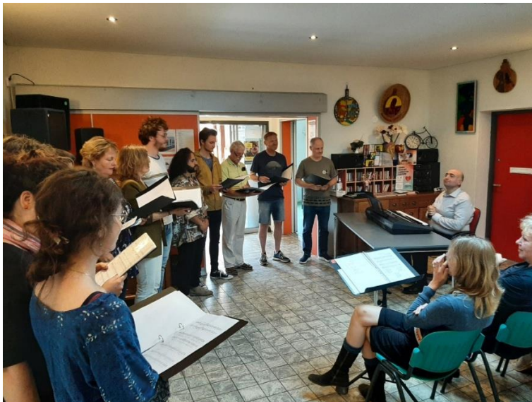
De wekelijkse repetitie van het Zwanenkoor in De Brug